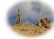
[2022년 7월 3일(가해) 연중 제 29 주일 의정부주보 2김명숙 소피아]

경제적으로 융성했던 소돔과 고모라를 하느님이 망하게 하신 건 비단 죄 때문은 아니었습니다. '회개'가 없었던 게 결정적 이유였습니다. 재앙을 앞두었던 니네베는 참회해서 구원받을 수 있었으니까요(요나 3 장). 소돔과 고모라는 회개의 촉구가 도움이 되지 않을 정도로 도덕적 뒤틀람이 심했던 모양입니다. 과거에는 악으로 여겨진 일들이 반복되면서 무의식 중에 일상으로 둔갑해가는 현상, 그런 도덕 불감증이 두 도시를 움켜쥐었던 건 아닐까요? 지금도 우리 사회에는 '도덕이 밥 먹여주냐?'는 말이 돌지만, 소돔과 고모라의 예에서 보듯, 도덕은 진정 밥을 먹여줍니다. 사기와 편법, 억압이 판치는 사회는 오염된 물 속의 물고기처럼 서서히 죽을 수밖에 없습니다. 성지에서 발견하는 소돔과 고모라는, 우리가 악의 만연함을 알면서도 뭇처럼 애써 무시하려 하는건 아닌지 돌아보게 합니다. (← 옆 사진: 소금기둥이 된 롯의 부인)