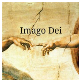
[2022년 11월 20일(다해) 온 누리의 임금이신 우리 주 예수 그리스도왕 대축일(성서 주간) 의정부주보 11면, 이승엽 미카엘 신부(선교사목국 신앙교육부)]

바오로 사도는 특별히 공동체 구성원들에게 “평화롭게 지내십시오.”(1 테살 5,13)라고 권고했습니다. 사실, 공동체에 속한 이들은 쉽게 대립할 수 있기에, 평화를 위한 특별한 노력이 항상 요구됩니다. 이처럼 평화를 위한 책임이 공동체와 그 구성원들에게 있습니다. 그리스도인은 스승이신 예수 그리스도께서 보여주신 모범에 따라 사랑을 실천함으로써 평화를 세상에 드러내야 합니다. 이는 그리스도인의 매우 중요한 사명입니다. 그들은 하느님께서 만드신 세상 안에 그분의 평화를 심는 농부여야 합니다. 이러한 삶은 단지 충돌 상황에서 조정자로 화해를 이루려는 것을 넘어, 이미 하느님의 평화를 경험한 사람으로서 자신의 모습으로 진정한 평화를 세상에 드러내는 것입니다. 이는 평화의 하느님, 하늘에 계신 아버지, 평화의 왕이신 주님의 모상(模像, Imago)으로 살아간다는 것을 의미합니다.