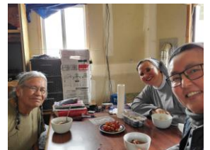
홀로 사시는 노인 방문