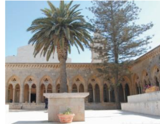
주님의 기도 성당

주님의 기도에는 “하늘에서와 같이 땅에서도 이루어지소서!” 라는 구절이 나옵니다. 이는 옛 성전에도 적용되는 내용입니다.